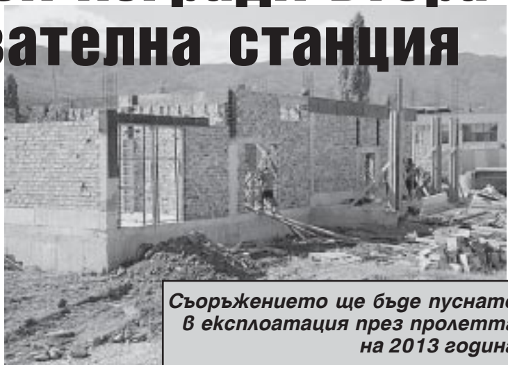
Съоръжението ще бъде пуснато в експлоатация през пролетта на 2013 година