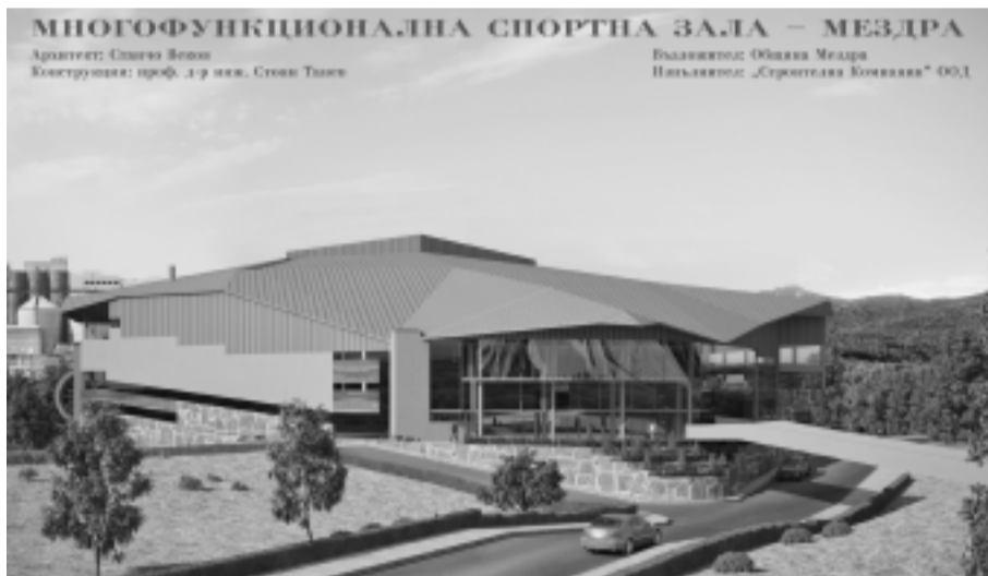
МНОГОФУНКЦИОНАЛНА СПОРТНА ЗАЛА - МЕЗДРА Архитект: Станко Велев Конструктор: проф. д-р инж. Стоян Тодев Благородие: Община Мездра Изпълнител: „Строителна Компания“ ООД

Другият проект, който ще получи държавно финансиране, е "Реконструкция на транспортна инфраструктура в община Мездра". Става дума за реконструкцията на 7 градски улици с натоварен трафик - западната част на ул. "Александър Стамболийски", "Веслец", "Любен Каравелов", "Динко Петров", "Паусий", "Роза" и "Брусненско шосе", както и на три участъци от IV-класната